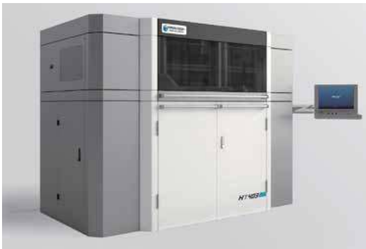
La stampante 3D 403P Serie 1 di Farsoon Technologies è equipaggiata con la tecnologia CodeMeter di Wibu-Systems per la produzione di pezzi di ricambio dei veicoli Daimler e Setra del gruppo Daimler Buses.